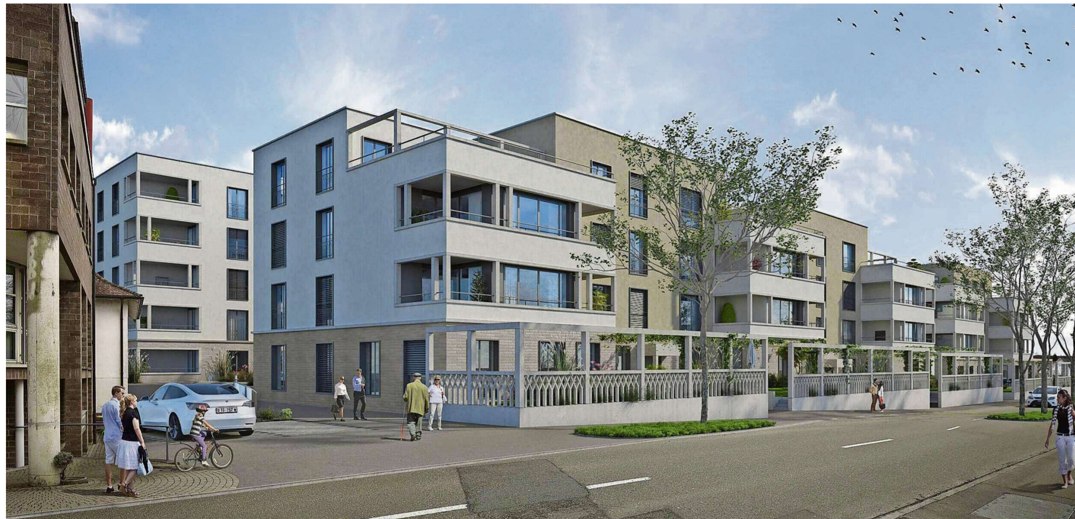
Die Überbauung prägt das Bild entlang der Bärenstrasse.