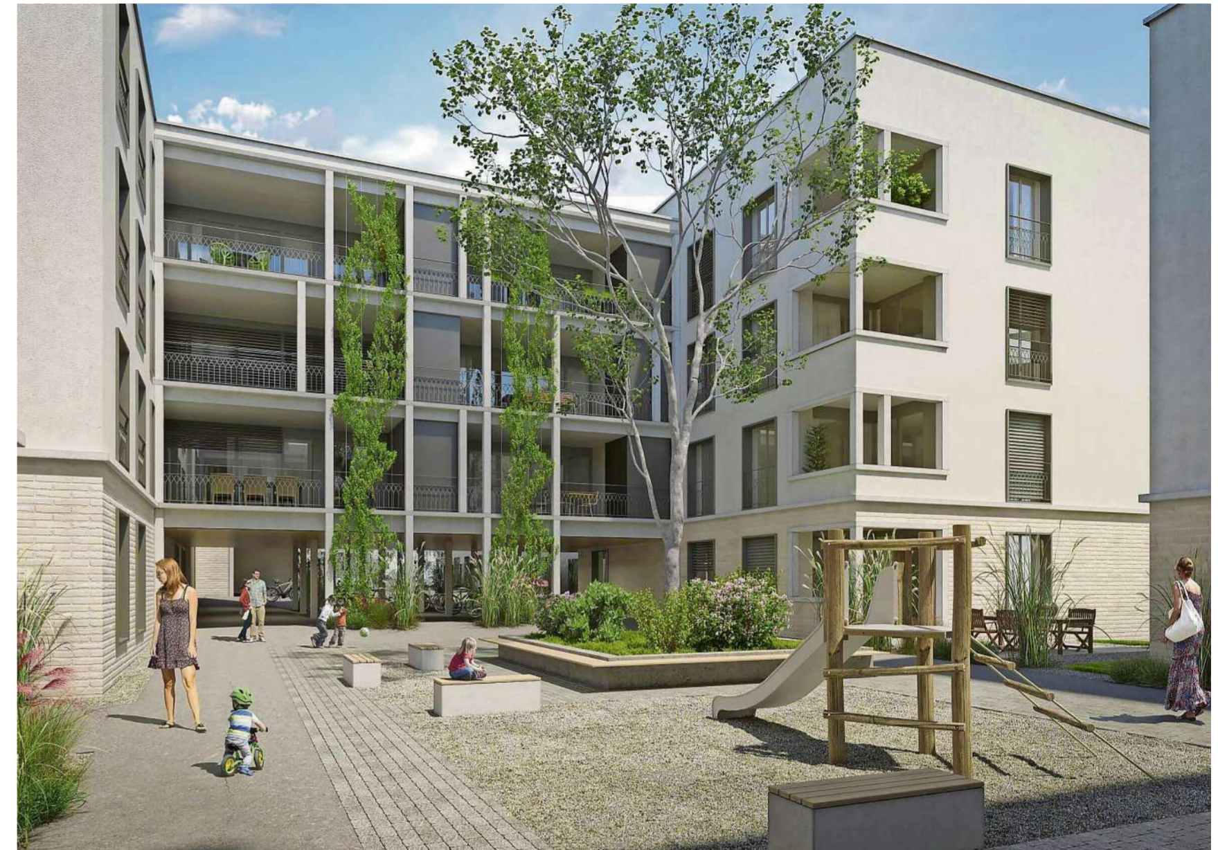
Visualisierung des Innenhofs mit Kinderspielplatz.

Die zwei ruhigen Innenhöfe laden zum Verweilen und Spielen ein. Eine digitale, zentrale Brief- und Paketanlage sorgt für ein praktisches Empfangen und Versenden von Paketen. Ein kleiner Schwatz mit den Nachbarn stärkt die Gemeinschaft. Und wer eine grössere Gästeschar bewirten möchte, kann eine der beiden Dachterrassen mit Aussenküche für sein Fest buchen. Jede Wohnung besticht durch interessante, individuelle Grundrisse und verfügt über einen privaten Aussenbereich (Loggia, Garten, Balkon oder Terrasse), einen Abstellraum, sowie eine eigene Waschmaschine mit Tumbler. Innovative digitale Technik macht die Häuser intelligent. Der in jeder Wohnung eingebaute Touchpanel ermöglicht die Kommunikation mit der Verwaltung, dient als Videogegensprechanlage, regelt Temperatur, Lüftung und Licht. Zudem werden die individuellen Energieverbräuche in Echtzeit angezeigt. Komfort steigert das Wohlbefinden. Multifunktionsräume wie Werkstatt, Trocknungsräume und zwei Dachterrassen mit Aussenküchen können nach Bedarf stundenweise gemietet werden.