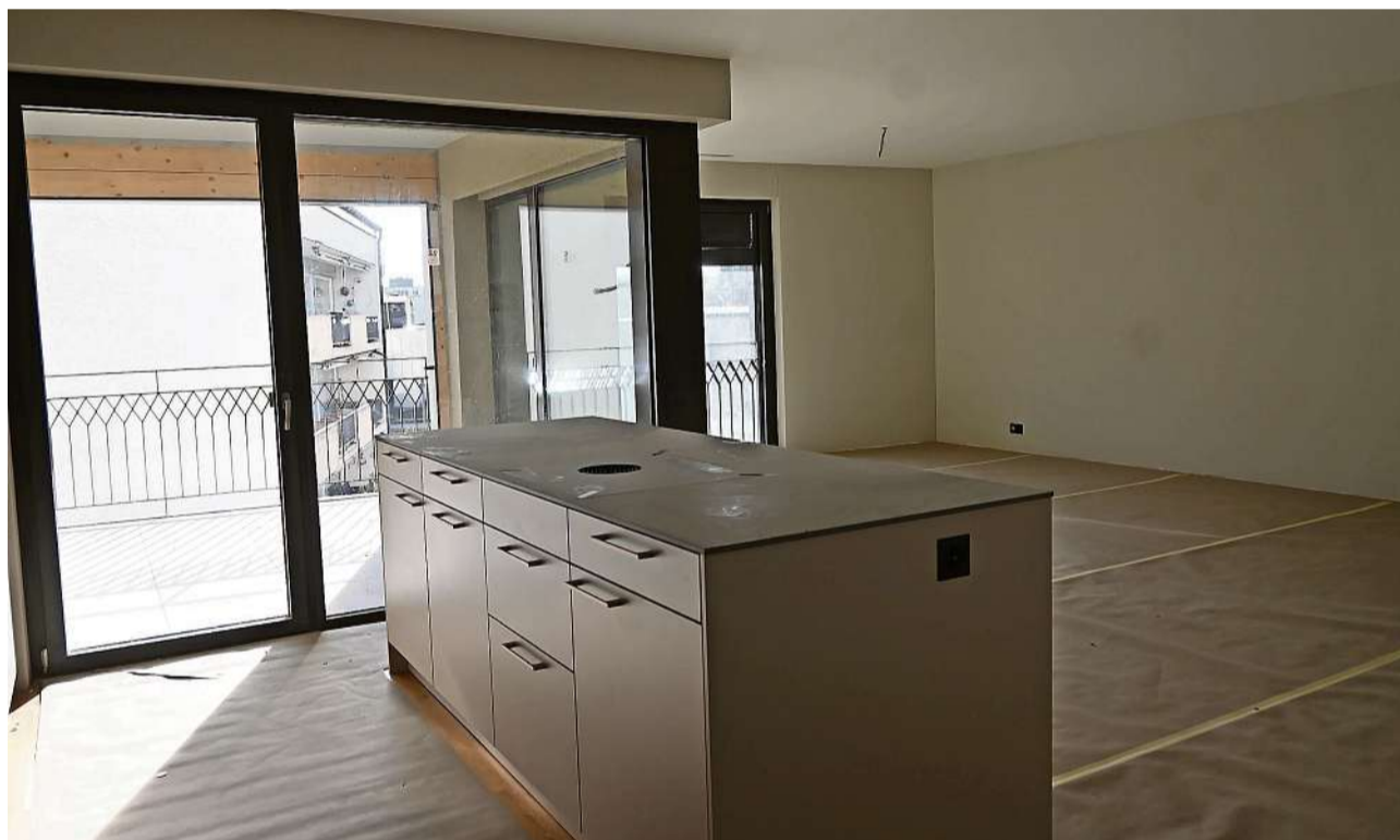
Schon bald bereit: Blick in eine Wohnung mit grossem Balkon.