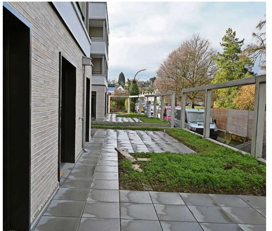
Die Wohnungen zur Bärenstrasse verfügen über einen höherliegenden Sitzplatz.